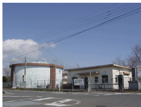
第1水源及び雪山配水池