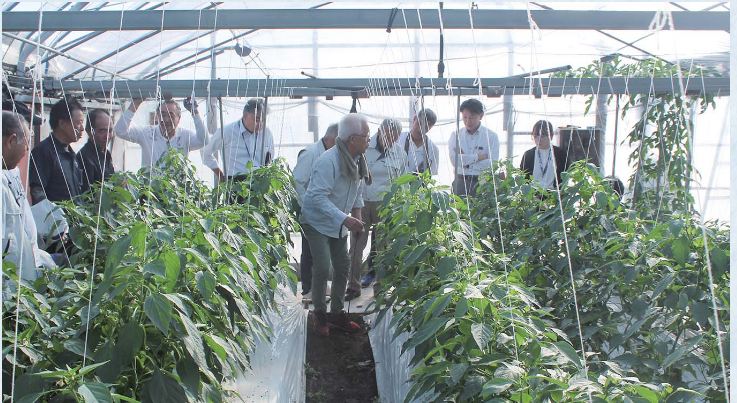
【写真】日置市農業委員会との合同研修会の様子