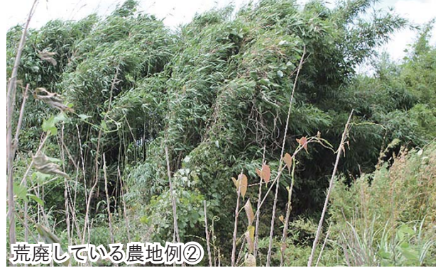
荒廃している農地例②