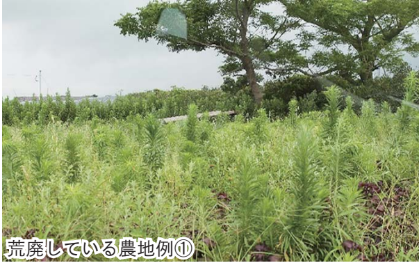
荒廃している農地例①

農地を自身で管理しきれない場合、農業委員会で耕作人を探すお手伝いが出来ますので、農地が荒廃する前に是非ご相談ください。